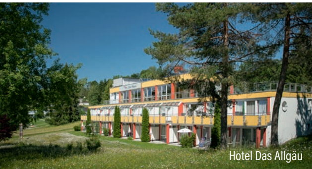
Hotel Das Allgäu