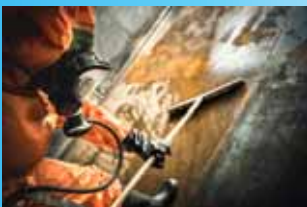
Foto "Tankreinigung"

Mehr als 50 % der Auszubildenden beenden in den ersten 18 Monaten ihr Ausbildungsverhältnis. Personalmangel in den Unternehmen gehört mittlerweile zum Standard.